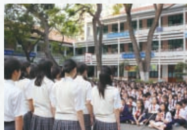
レクイドン中学校との交流