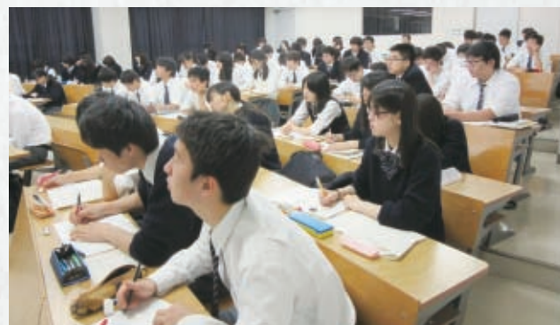
難関大学を目指し土曜学力向上講座に真剣に取り組む生徒(予備校講師による英・数・国の学力向上講座)

運動部は24部、文化部25部もあります。サッカー部(全国選手権14回出場優勝1回・準優勝1回・3位3回)・水泳部(創部以来48年連続インターハイ出場)・陸上部は全国大会の常連です。多くの部活が学業と両立させながら高い実績をあげています。