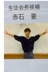
選挙ポスターと公約