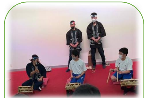
秩父屋台囃子保存会の皆さんによる

今回の取組で、生徒たちからは、「探究活動に班の人たちと協力して取り組めたと思います。」「探究活動では、周りの人とわからないことがあったとき、助けながら学習を進めることができました。」「日本の地層や世界の地層のことを学べて有意義でした。」「一番不安に感じていた、調べたことを協力して発表することが上手にできてよかった。」「他の班の発表を聞いて幅広く勉強できました。」といった感想が寄せられました。生徒たちが自ら課題を設定し、生き生きと協力して学び合い、発表する姿は素晴らしく、思考力や、判断力、表現力を培うまたとない機会になりました。