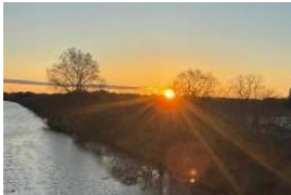
令和6年初日の出（芝川）