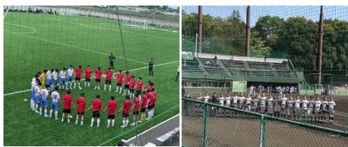
関東高校サッカー大会