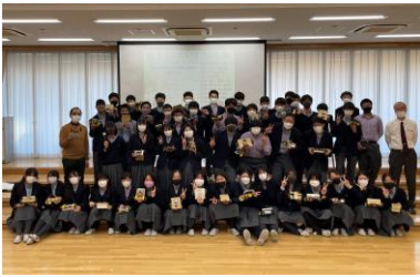
製作した作品を持って記念撮影

〒335-0002 埼玉県蕨市塚越 5-10-21 電話 048(441)6948